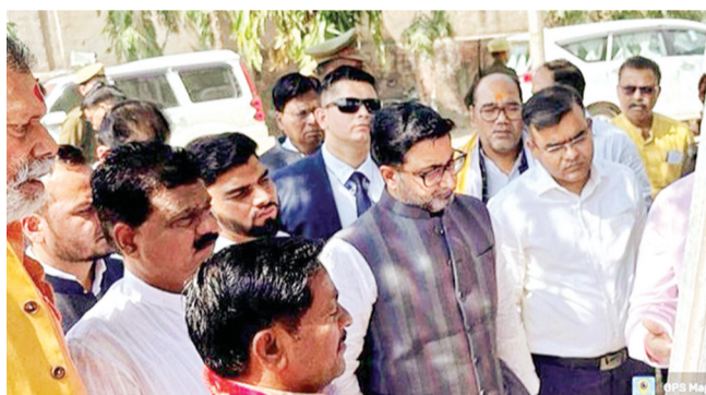
हरिभूमि न्यूज ललितपुर

गुरुवार को प्रभारी मंत्री दानिश आजाद अंसारी ने अमृत 2.0 कार्यक्रम के अंतर्गत इलाइट चौराहा मरघट स्थित 2700 किलो लीटर उच्च जलाशय का औचक निरीक्षण किया। प्रभारी मंत्री ने अप्रैल माह के अन्त तक इलाइट चौराहा स्थित उच्च जलाशय से पेयजलापूर्ति करने, शहर में पाइप लाइन बिछाने के दौरान काटी गई सड़कों की युद्ध स्तर पर मरम्मत कराने एवं एनएचआई, लोक निर्माण विभाग, सिंचाई विभाग इत्यादि से कार्य करने की अनुमति न मिलने पर विभागों से समन्वय स्थापित कर कार्य कराने के निर्देश दिये।