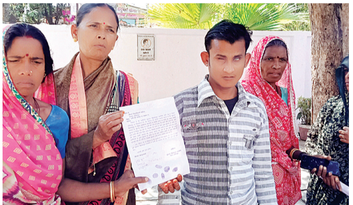
हरिभूमि न्यूज ललितपुर

शहर के वार्ड नंबर-2 स्थित खिरकापुरा स्थित काशीराम कॉलोनी के निवासी इन दिनों बूंद-बूंद पानी के लिए तरस रहे हैं। लंबे समय से चल रही पानी की किल्लत से परेशान होकर दर्जनों मोहल्लावासी गुरुवार को जिलाधिकारी कार्यालय पहुंचे और शिकायती पत्र सौंपकर समस्या के समाधान की मांग की। जिलाधिकारी को सौंपे गए पत्र में निवासियों ने बताया कि कॉलोनी में स्थित पानी की टंकी से सप्लाई ठप पड़ी है। स्थिति तब और विकट हो गई जब मोहल्ले में मौजूद एकमात्र सरकारी बोरवेल पर भी कुछ दबावों या स्थानीय लोगों द्वारा कब्जा करने की बात सामने आई। निवासियों का आरोप है कि उन्हें बोरवेल से पानी नहीं भरने दिया जा रहा है, जिससे दैनिक कार्यों के लिए भी पानी जुटाना मुश्किल हो गया है। क्षेत्रीय लोगों में स्थानीय जनप्रतिनिधि के खिलाफ