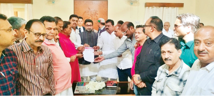
हरिभूमि न्यूज ललितपुर

गाड़ियों की उपलब्धता के लिए प्रशासन अग्नि समन अधिकारी एवं जिलाधिकारी महोदय के माध्यम से उत्तर प्रदेश शासन में महानिदेशक अग्निशामन तथा आपात सेवा उच्च प्रदेश लखनऊ द्वारा पत्र संख्या II403-1 दिनांक 03, 11, 2023 से अनु स्मारक पत्र दिनांक 11, 12, 2023, 01, 0, 5, 2024 एवं 25, 10, 24 द्वारा प्रमुख सचिव गृह उच्च प्रदेश शासन लखनऊ को जिलाधिकारी महोदय एवं अग्निशामन अधिकारी द्वारा पत्राचार किया जा रहा है लेकिन अभी तक सिर्फ पाली मड़वारा महरोली नारा में सिर्फ भूमि आवंटन की गई है सब स्टेशन निर्माण के लिए एवं हर तहसील में