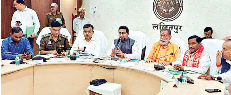
हरिभूमि न्यूज ललितपुर

सीएम डैशबोर्ड पर प्रदेश में ललितपुर को प्रथम स्थान मिलने पर प्रभारी मंत्री खुश